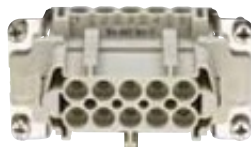
CNE 10 / CSE 10 Kontakteinsätze 10-polig Motorstecker