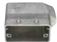
CH S / MH S Gehäuse Aluminiumdruckguss, EMV-Ausführung