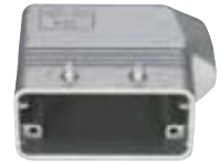
CH / MH Gehäuse Aluminiumdruckguss