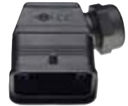
CQ 08 Gehäuse Kunststoff