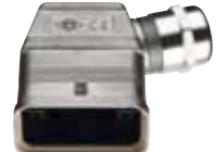
CQS 08 Gehäuse Kunststoff metallisiert / EMV-Ausführung