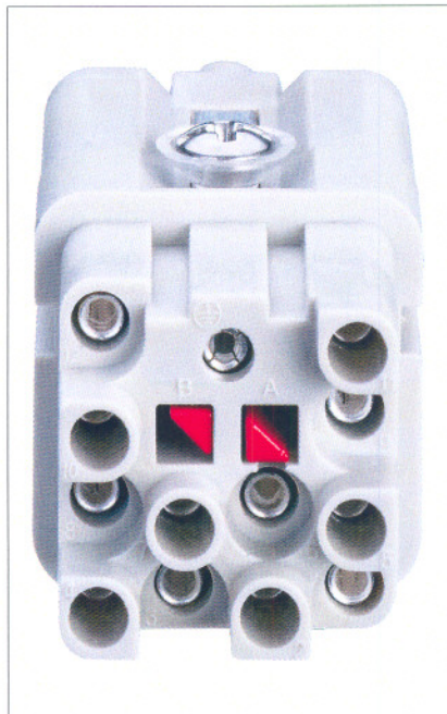
Bild 1. Das dreidimensionale Steckprofil erhöht die Luft- und Kriechstrecken

ein höhenversetztes Steckprofil die Luft- und Kriechstrecken und damit die Spannungsfestigkeit des Steckverbinders erhöht.