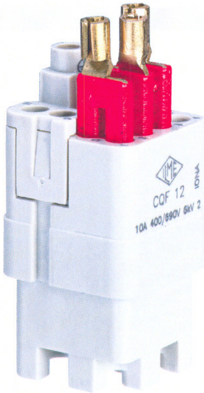
Bild 2. Mittels entsprechender Steckbrücken können Stern- und Dreieckschaltungen hergestellt und im Buchseneinsatz des Steckverbinders integriert werden

werden, da eine Codierung über die Befestigung des Einsatzes im Gehäuse mithilfe von Codierstiften und -buchsen in dieser Baugröße nicht infrage kam. Somit blieb nur der Weg, die Codierung in das Steckprofil zu integrieren. Der CQ 12 löst diese Anforderung nun mit je zwei Codierelementen auf jeder Seite, die jeweils in vier Positionen angeordnet werden können. Daraus ergibt sich eine 16-fache Codierbarkeit des Steckverbinders.