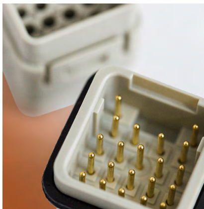
Hohe Kontaktdichte auf 21 x 21mm